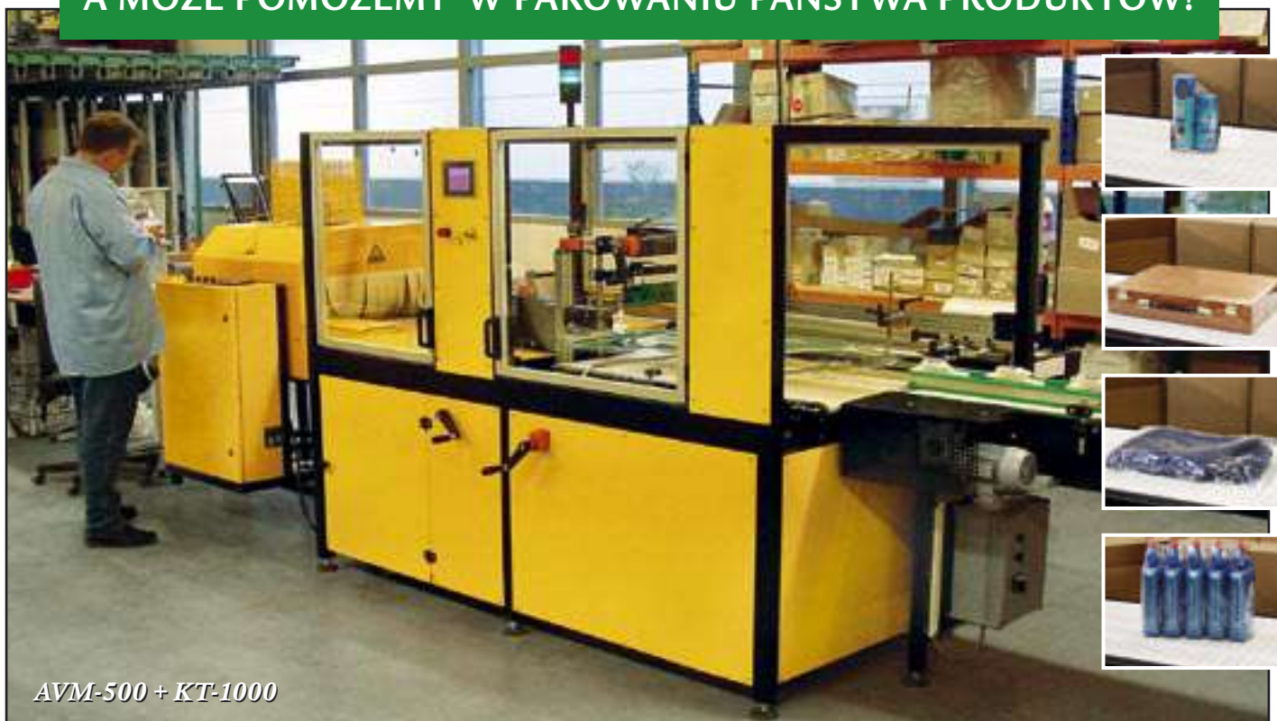
AVM-500 + KT-1000

Firma AVC Sealing Solutions jest dynamicznie rozwijającym się przedsiębiorstwem z długoletnim doświadczeniem i przejrzystymi ambicjami: chcemy być najlepsi w naszej branży. I możemy powiedzieć, że od dawna jesteśmy na dobrej drodze do tego celu. Dzięki pracom doświadczalno-rozwojowym stale rozbudowujemy i poszerzamy naszą wiedzę techniczną. W odniesieniu do naszych – a ostatecznie - Państwa - maszyn i urządzeń zdecydowanie chętniej używamy określenia „rozwiązanie techniczne” niż produkt. Jako specjaliści w dziedzinie urządzeń zgrzewających i obkurczających folią staramy się zaoferować każdemu Klientowi pełny i dopasowany do istniejącej i wymaganej sytuacji projekt rozwiązań technologicznych. Decydując się na współpracę z nami, każdy z naszych Klientów otrzymuje najwyższej jakości urządzenie, montowane i uruchamiane przez nas na miejscu, w zakładzie Klienta. W każdym przypadku mamy do czynienia z